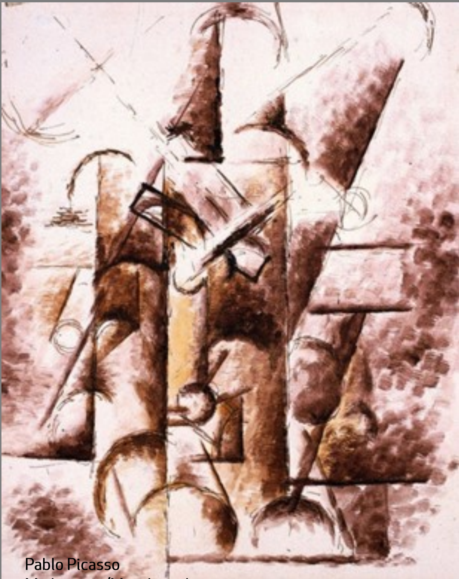
Pablo Picasso Miehen pää/Manshuvud, 1912 (Seepia, tussi, quassi paperille 28x22)