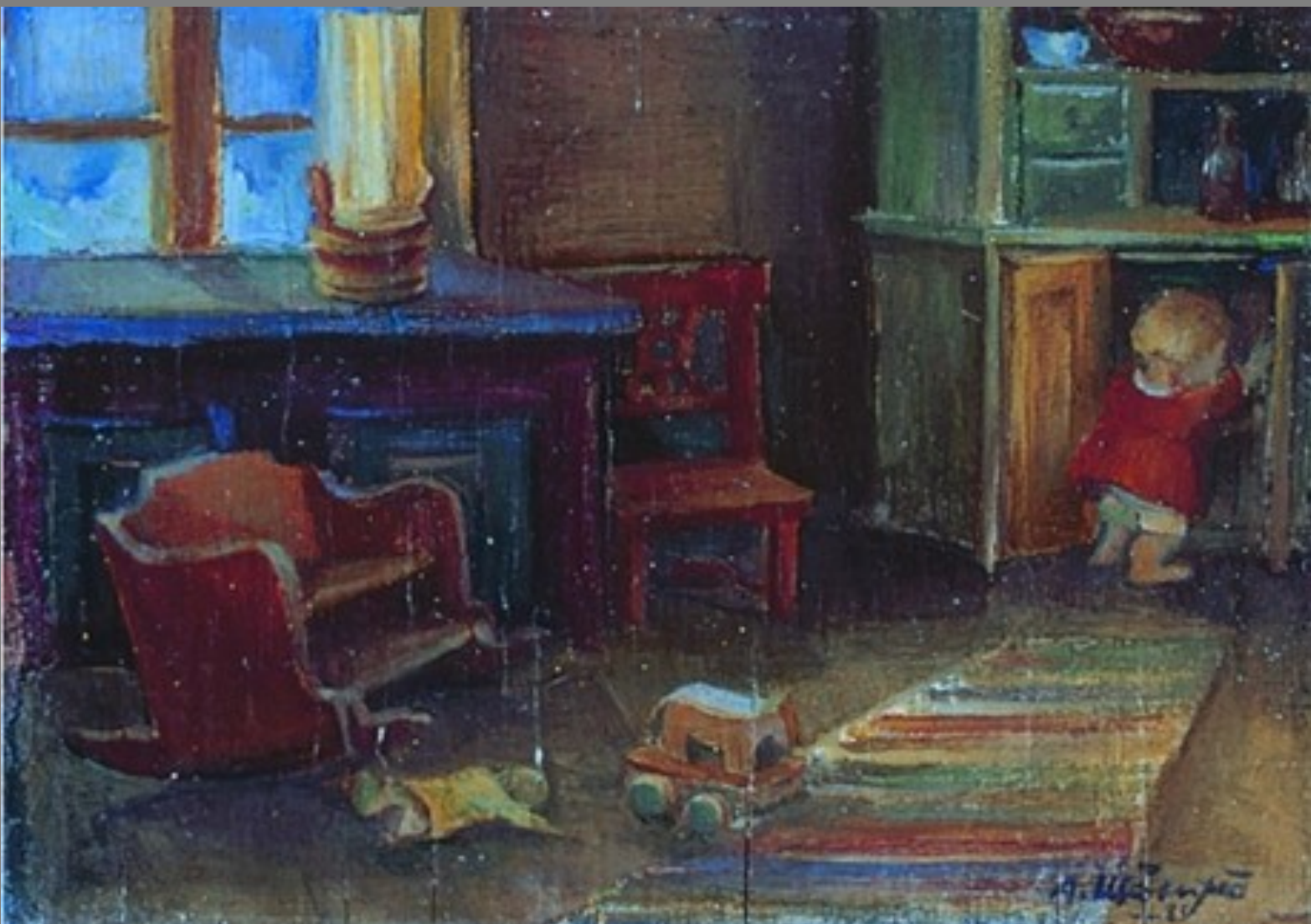
Arvi Mäenpää Sokerihiiri/Sockerråttan, 1935 (öljy/olja 4,5x6,4)